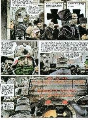
Enki Bilal, La Foire aux immortels , 1980. © Casterman.

Yazarların ve Casterman Yayınları'nın izniyle.