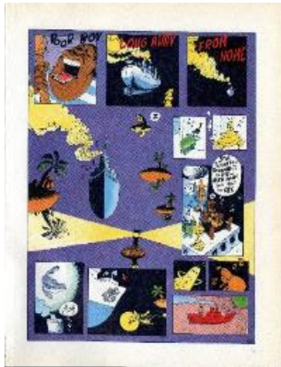
Nikita Mandryka, Le Concombre masqué , Rêves de sable 2 , Le Retour du Concombre masqué , Dargaud, 1975.