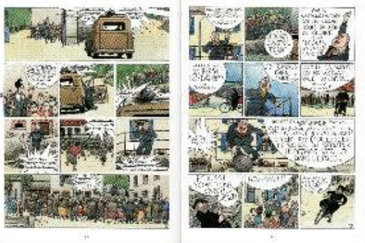
Baru, Les Années Spoutnik cilt 1, Le Penalty , 1999. © Casterman.

Yazarların ve Casterman Yayınları'nın izniyle.